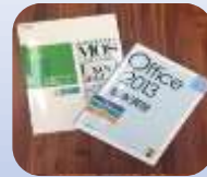
仕事実践&資格勉強