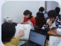
自分のペースでパソコン