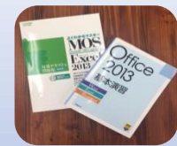
仕事実践&資格勉強