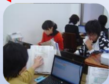
自分のペースでパソコン