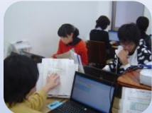
自分のペースでパソコン