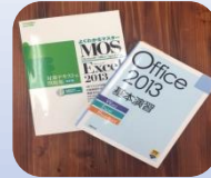
仕事実践&amp;資格勉強