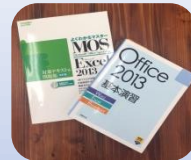
仕事実践&資格勉強